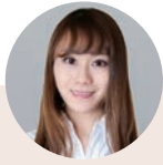
デリスタグラマー amikuma1219

自宅にパン教室を開業。ローフードマイスター1級、ファスティングマイスターエキスパート取得し、ファスティング・体質改善プログラムスタート。独自の米粉PRO養成講座をスタート。楽しみながら、美しく、健康になるための、お料理教室(ローフード・グルテンフリー他)、ファスティング・体質改善フォローを行っている。